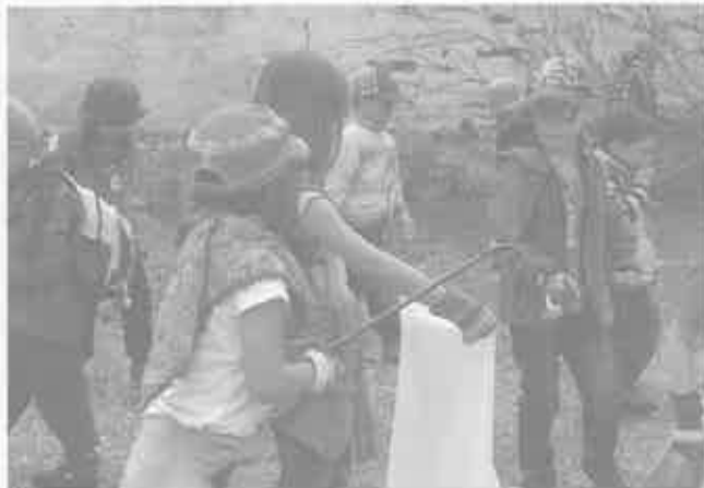
Kindergarten Lila Villa

Im Zuge der Dellmensingener Dorfputzete beteiligten wir uns auch an der Reinigungs-Aktion. Gut ausgestattet mit Handschuhen, Müllzwickeln, Müllsäcken, „Servicefahrzeug“ und einer großen Portion Freude, zogen wir bei gutem Wetter Richtung Schlossgarten. Kein noch so kleiner Abfall war vor den Kinderhänden sicher und wanderte zielsicher in den Sack. Nach getaner Arbeit stärkten wir uns mit leckeren „Seemann“-Brezeln und besetzten zu guter Letzt den Spielplatz vor Ort.