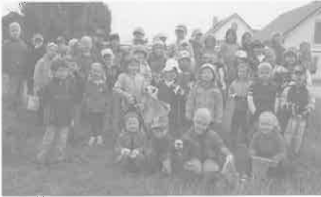
Kindergarten Don Bosco

In allen Bereichen der Dellmensingener Gemarkung wurde der Müll aufgesammelt.