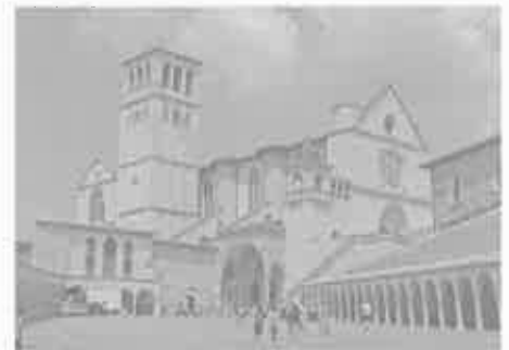
Basilika San Francesco Assisi