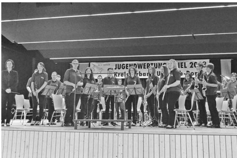
Jugendwertungsspiel in Rottenacker