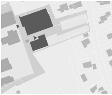
Variante 1 Generalsanierung mit Umstrukturierung und Neubau Einfeldhalle