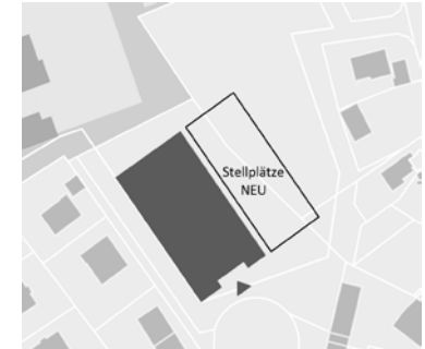
Variante 5 Neubau 3 Feldhalle am neuen Standort