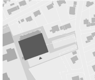
Variante 3 Neubau 3 Feldhalle am bestehenden Standort