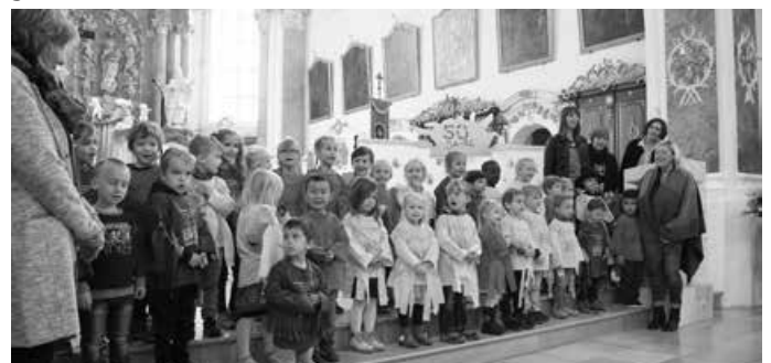
Das Team vom St. Franziskus Kindergarten