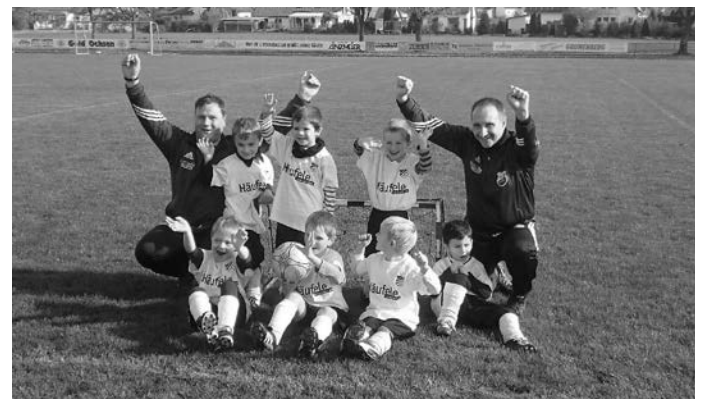
Bambini mit den Erfolgs Trainern

Zu unserem letzten Spieltag in diesem Jahr sind wir nach Unterstadion aufgebrochen. Wir konnten hier einmal mehr unser Können unter Beweis stellen und mussten feststellen, dass wir in den Spielen sehr gut mithalten konnten und auch so manches Schöne Tor wurde von dem Bambini geschossen. Es hat wieder allen sehr viel Spaß gemacht. Wir konnten aus diesen Spieltagen sehr viel Erfahrung mitnehmen und freuen uns schon auf die Hallensaison.