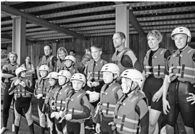
Das Jugend Ski Team bei der Einweisung zum Wasserski fahren

Der diesjährige Sommerhütten Aufenthalt des JST begann am Freitag, den 11.07. mit dem Treffen zum Wasserskifahren am Insee bei Blaichach bei Immenstadt. Es standen 2 Stunden Wasserskifahren am Wasserskipark auf dem Plan. Das Wetter meinte es „relativ“ gut mit dem Team. Die Regenschauer tobten sich in den Bergen rund um den kleinen See aus. Bei uns blieb es von „oben“ zumindest trocken, die Wassertemperatur war „o.k.“ und in den Neoprenanzügen war es dann eine „Riesen Gaudi“. Anfängliche Bauchlandungen entmutigten die Kids, Trainer und Eltern nicht und alle (fast alle) konnten am Ende ihre Runde(n) drehen. Das geplante Picknick auf der Liegewiese fiel leider aus, weil der Boden doch etwas zu sehr unter dem Regen gelitten hatte. Es wurde dann nach dem Einchecken auf der Erbacher Hütte ausgiebig zu Nacht gegessen.