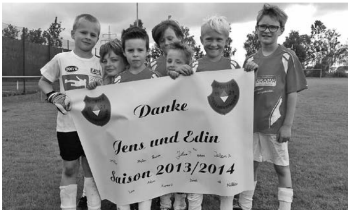
Mannschaftsfoto Team Rot