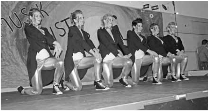
Showtanzgruppe Illegal der SF Donaurieden