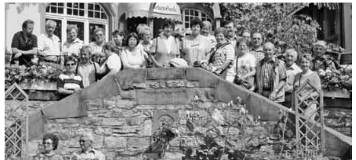
07.-08.06.2008 Bad Rappenau

Am Samstag, den 08. März 2014 um 20.00 Uhr in der Dorfmitte. Mit einer Diashow blicken wir zurück auf unsere Vereinsarbeit in den letzten 10 Jahren.