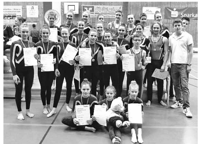
Die drei TSV Erbach TeamGym Mannschaften

Platz 1 Schüler Mädchen 37,55 P. , Platz 1 Offene Klasse Mixed 37,4 P. und Platz 2 Jugend Leistungsklasse 39,25 P. Württemberg. Landessieger ga