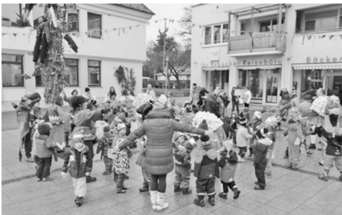
Kiga St. Franziskus und Narren

Ein Dankeschön an die Narren der NZ Erbach sagen die Kinder und Erzieherinnen