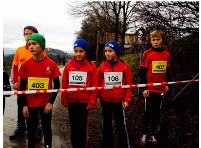
Corosslauf in Blitzenreute