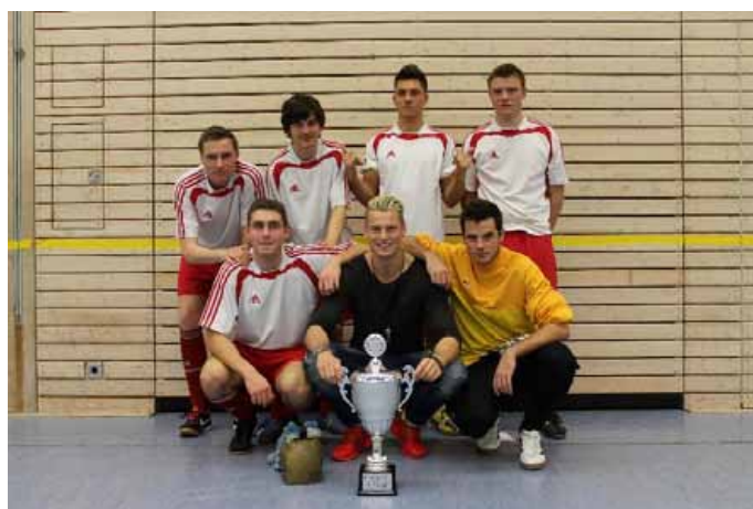
Hoba-Crew, Sieger des Dreikönigscup 2014