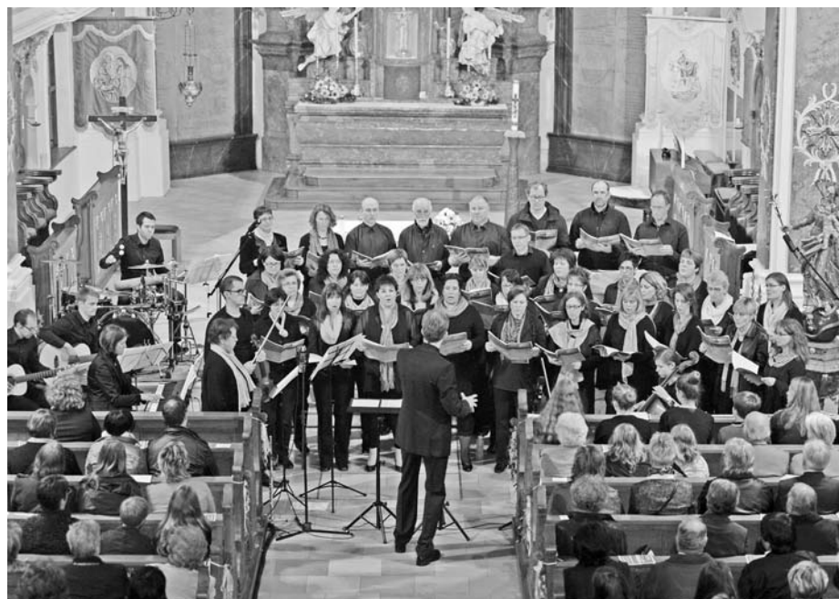
Singkreis und Instrumentalisten

Anmeldung BUND 0731/66695 oder Heuchel: 07305/3650)