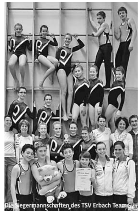
Die Siegermannschaften des TSV Erbach TeamGym

Mädchen: Beginnend mit der Disziplin Boden , d.h. Tanz mit Elementen aus Balance, Akrobatik, Sprung, Gleichgewicht und Kraft. Das Training hat sich gelohnt, denn die Mädchen turnten sauber und sehr synchron. Unsere stärkste Disziplin Trampet (Sprung) mit Überschlägen, Salti gehockt, gebückt und gestreckt wurde wie immer sauber geturnt, sodass wir bereits nach dieser Disziplin auf Platz 2 lagen. Bei unserer letzten Disziplin Tumbling turnten wir erstmalig Doppel Flick Flacks, sowie Salti vorwärts und rückwärts. Die Nervosität war extrem, da die Bewegungsabläufe zum Teil noch nicht automatisiert sind. Jedoch tunkten sie alles durch ohne Stürze, was uns am Ende auf einen souveränen Platz 2 brachte. Ziel: TeamGym Cup beim Internat. Dt. Turnfest 18.-25. Mai 2013 Metropolregion Rhein Neckar